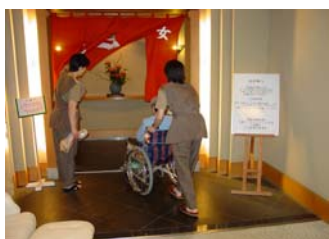
スパヘルパーは2名です

【対象のお客様】 介護保険法で定める「自立」から「要介護2」程度の方を対象としています。 (介添えがあればつかまり立ちができる方)